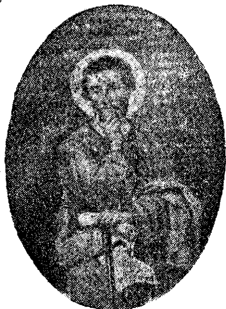
San Paolo, proteggi la Buona Stampa